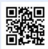
教育部詐騙 防制專區

教育部與內政部持續緊密合作，提供孩子最即時的協助與支持。如果孩子遇到任何可疑情況或懷疑自己受騙，可以撥打「反詐騙諮詢專線165」或使用警政服務APP尋求幫助，希望每位孩子都能在保護自己的前提下，盡情享受學習、體驗新事物，度過一個充實且愉快的假期。