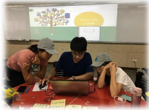
教案活動設計指引撰述