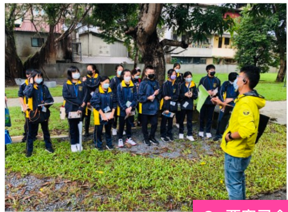
C. 要塞司令部 校官眷舍